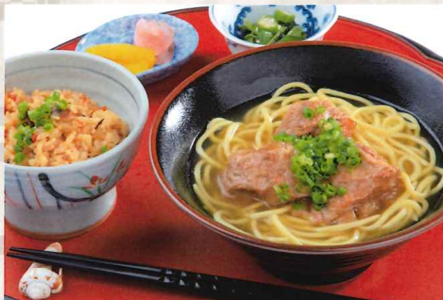
八重山ソーキそば & ジューシーセット 1,800円