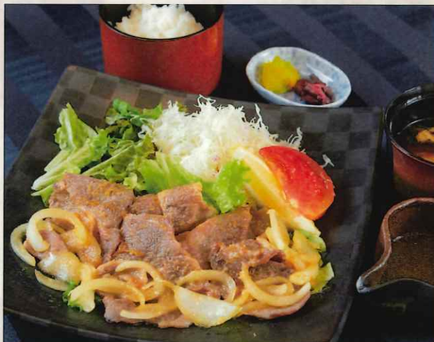
豚生姜焼き御膳 1,500 円