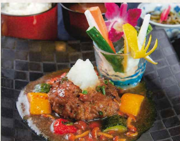
石垣牛ハンバーグ御膳 3,000 円