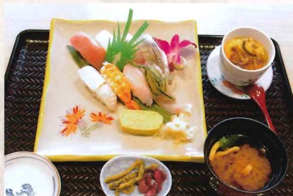
握り寿司 (8貫) 2,000 円