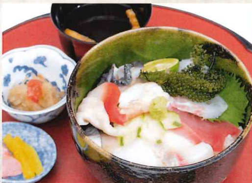
海鮮井 2,100 円