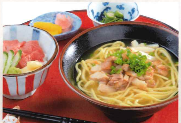
八重山そば & ミニマグロ丼セット 1,800円