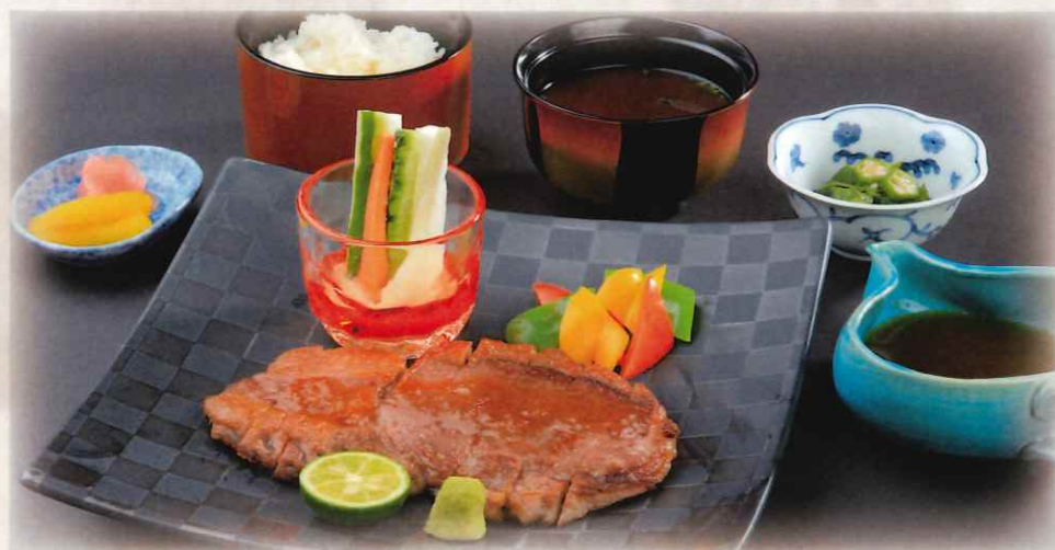
石垣牛ステーキ御膳(150g) 10,000 円