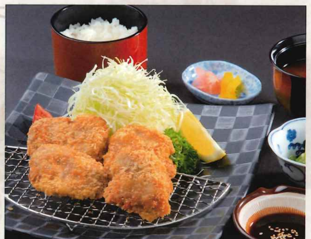
アゲー豚ヒレカツ御膳 2,500 円

お食事をご注文されたお客様/ ドリンクバー付き コーヒー、ソフトドリンクなど ご自由にお飲み下さい。