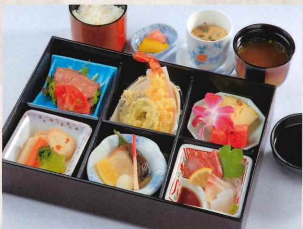
幕の内御膳 (上) 六つ切り 3,000 円