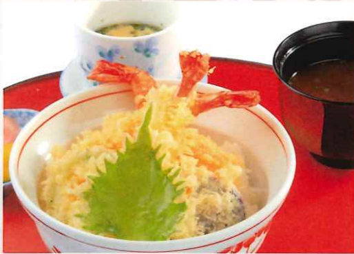
天井 1,600 円

お食事をご注文されたお客様/ ドリンクバー付き コーヒー、ソフトドリンクなど ご自由にお飲み下さい。