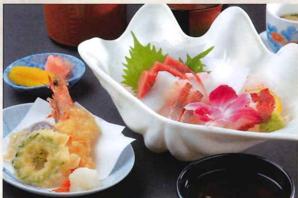
刺身御膳 3,000 円

お食事をご注文されたお客様/ ドリンクバー付き コーヒー、ソフトドリンクなど ご自由にお飲み下さい。