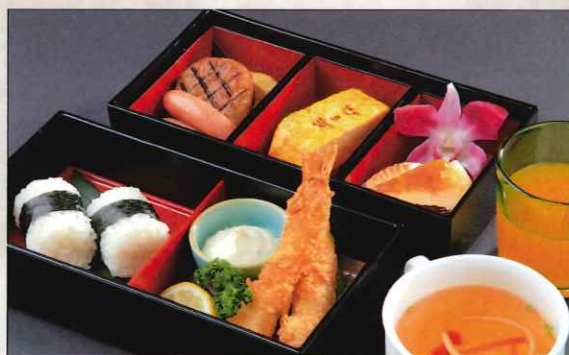
お子様御膳 1,800 円 ※お子様限定