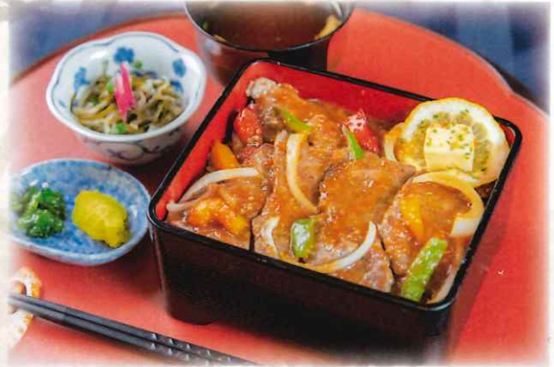
ステーキ重 1,800 円