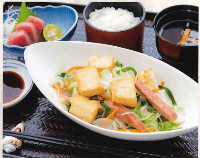
豆腐チャンプルーセット (刺身付) 1,500 円