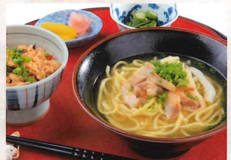
八重山そば & ジューシーセット 1,500円