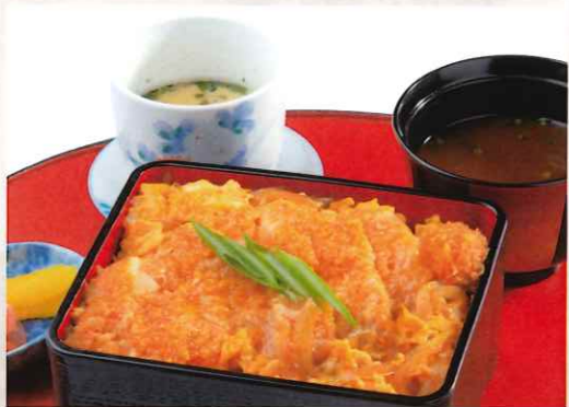
アグーヒレカツ重 1,800 円