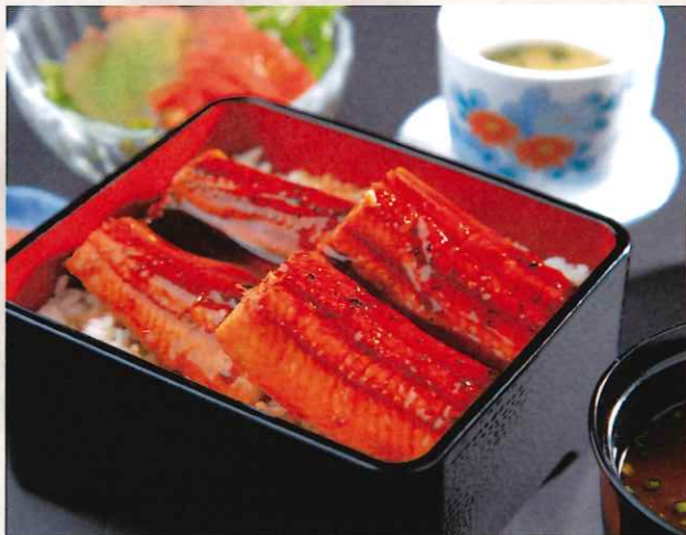
うなぎ御膳 4,500 円