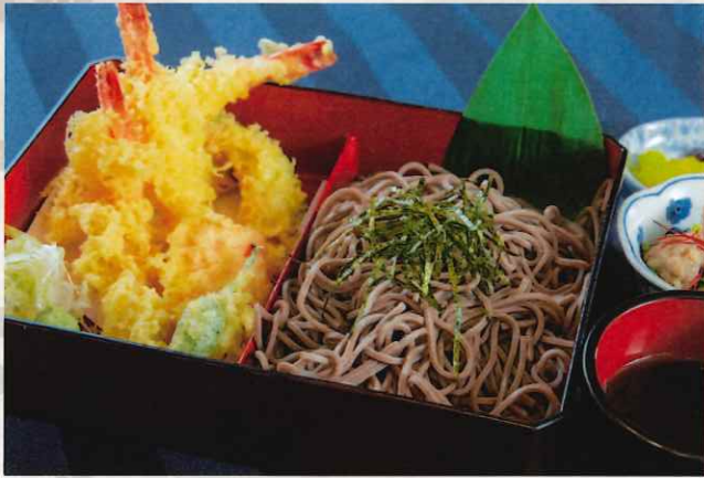
日本そば又はうどん 天ざるセット (温・冷) 1,600円