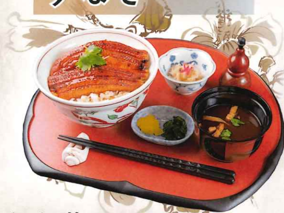
うなぎ 2,500 円