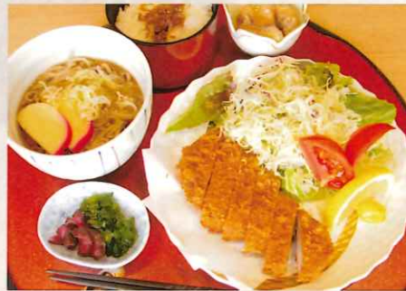
日本そば & トンカツセット 1,600円