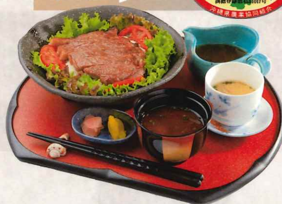
石垣牛ステーキ丼セット(100g) 5,800 円