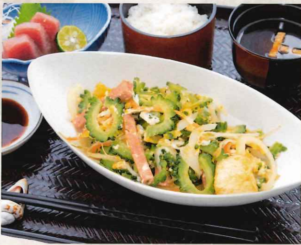
ゴーヤーチャンプルーセット (刺身付) 1,500 円