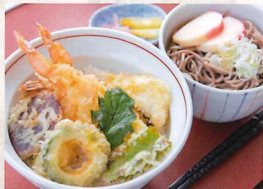
天井と小そばセット 1,800 円