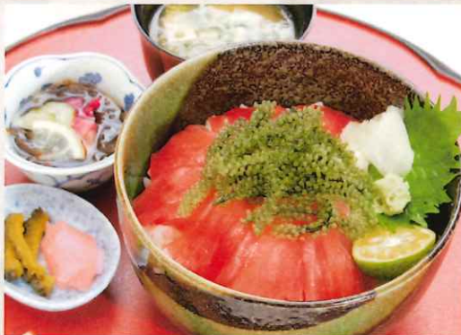
海ぶどう井 2,000 円