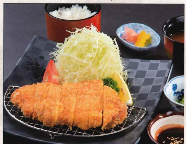
ロースカツ御膳 2,000 円