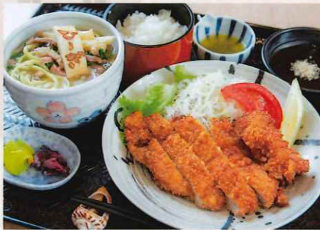
八重山そば & トンカツセット 1,600円