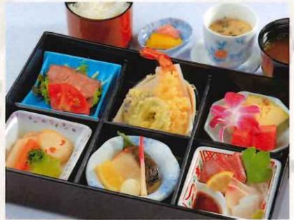
幕の内御膳 (六つ切) 3,000 円