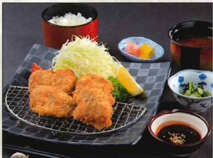
アグー豚ヒレカツ御膳 2,500 円