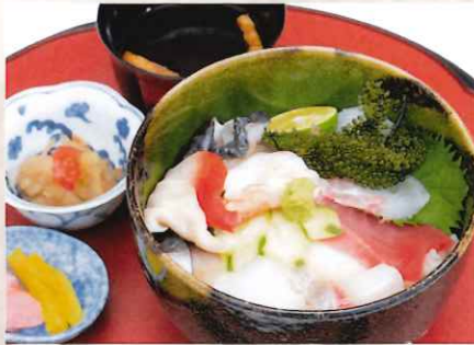
海鮮丼 2,100 円