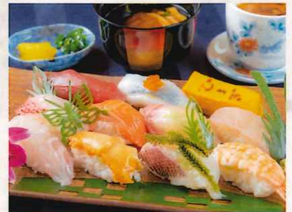
寿司御膳 (特上 10 貫) 3,000 円