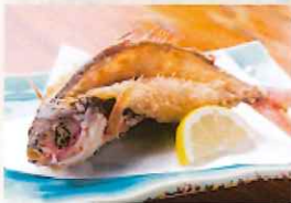
グルクンの唐揚げ