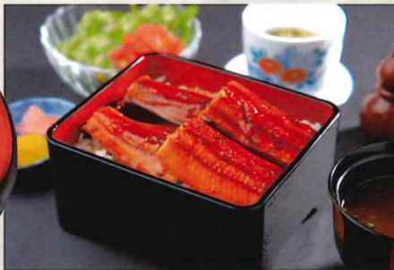
鰻御膳 4,500 円