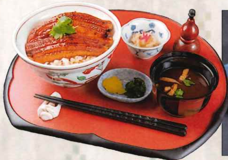
うな丼 2,500 円