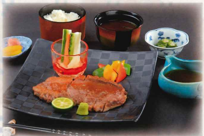
石垣牛ステーキ御膳 10,000 円