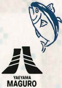
近海鮪盛り合わせ