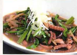
ウムズナーチャンプル