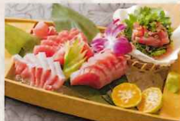
近海鮪盛り合わせ