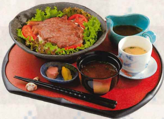
石垣牛ステーキ丼セット 5,800 円