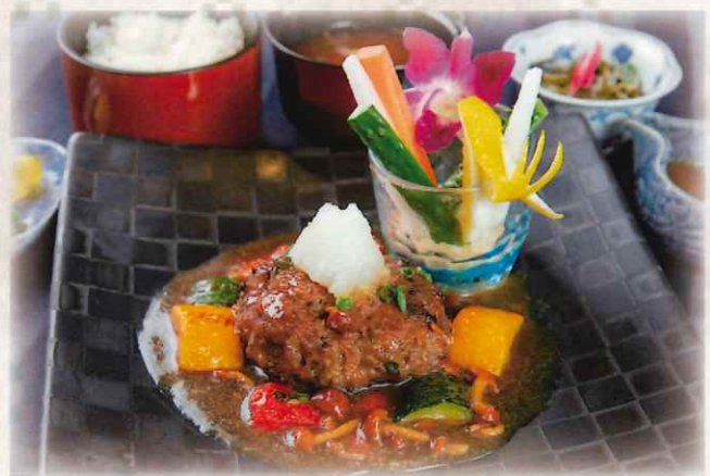
石垣牛ハンバーグ御膳 3,000 円