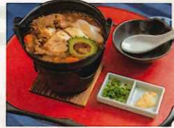
県産和牛と島豆腐小鍋