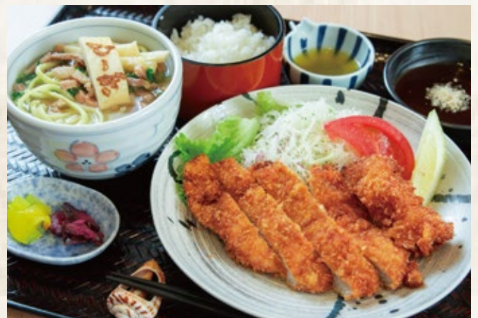
トンカツセット 1,800 円 八重山そば又は日本そば