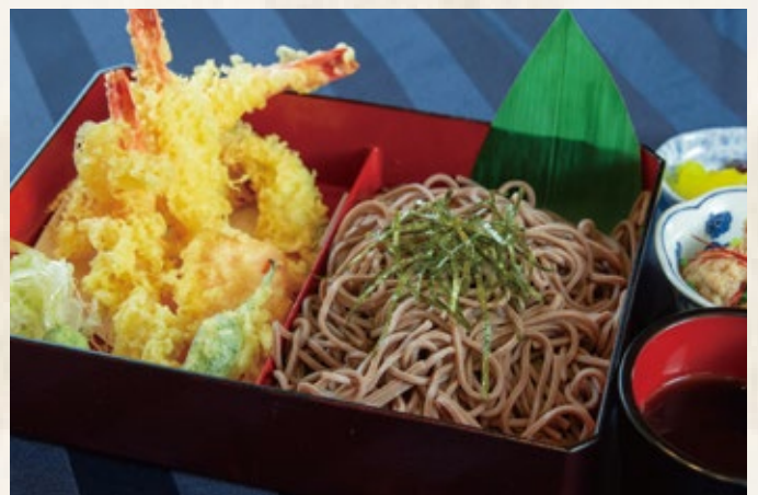
天ぷらセット 1,800 円 日本そば又はうどん (温・冷)