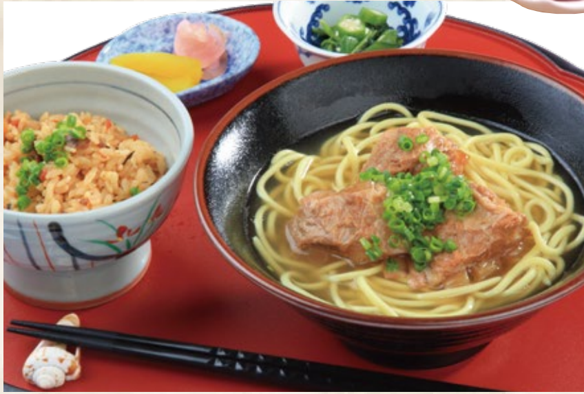
ソーキそば & ジューシーセット 2,000 円