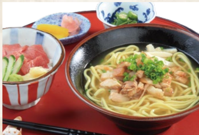
八重山そば & 小鉢・水雲・香の物付き ミニマグロ丼セット 2,000 円