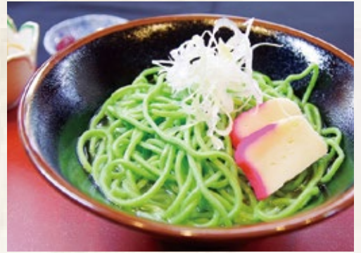
ユウグレナ クロレラそば 1,600 円