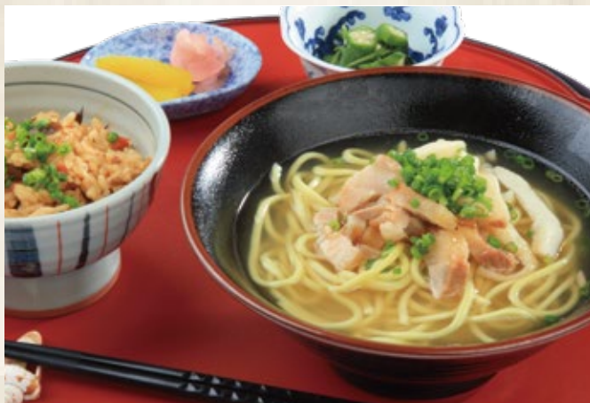
八重山そば & 1,700 円 ジューシーセット