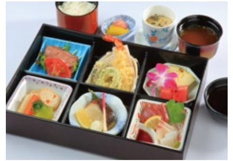
幕の内御膳 3,200 円

刺身・石牛ローストビーフサラダ・煮物・天婦羅・焼き魚 茶碗蒸し・フルーツ・白御飯・香の物・お味噌汁