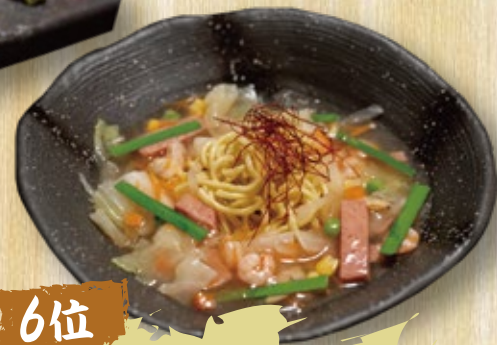
八重山そばちゃんぽん 1,300円