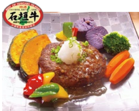
石垣牛ハンバーグ御膳 3,200 円