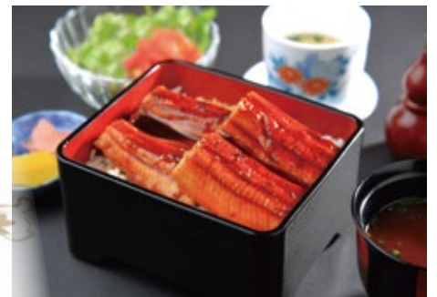
国産うなぎ御膳 6,500 円