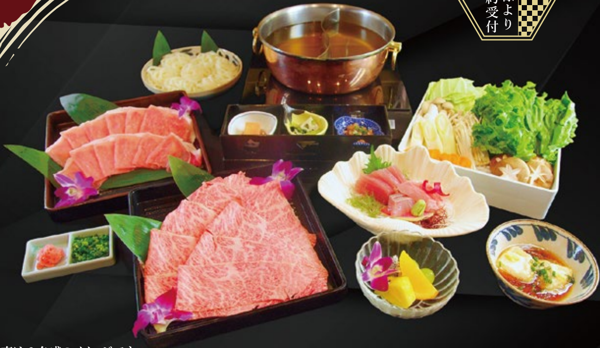
※写真は2名盛のイメージです