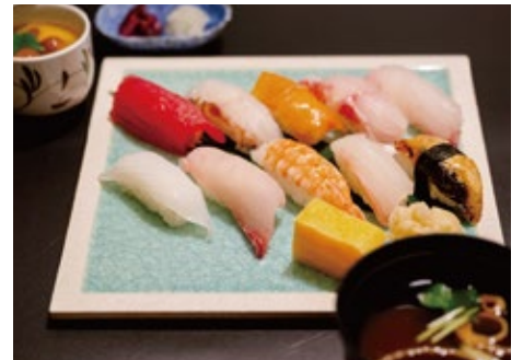
寿司御膳(特上10貫) 3,200 円