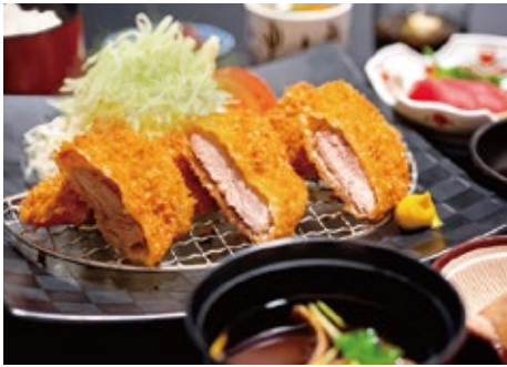
アグー豚ヒレカツ御膳 2,700 円