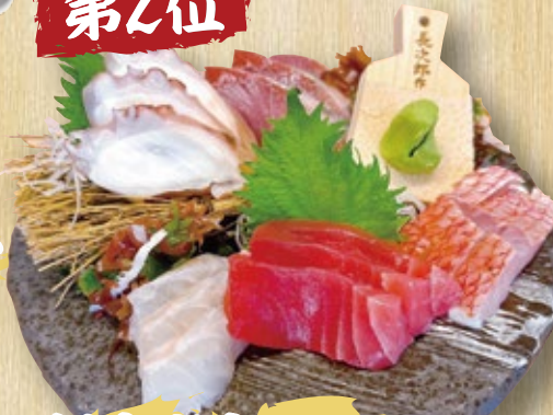
刺身盛合せ (1~2人前) 1,500円