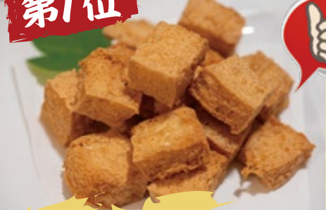
島豆腐のガーリック揚げ 780円