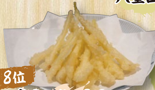
島らっきょうの 天ぷら 800円