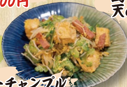
ゴーヤーチャンプル 1,100円