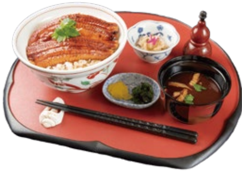
国産うなぎ 4,000 円

刺身・石牛ローストビーフサラダ・煮物・天婦羅・焼き魚 茶碗蒸し・フルーツ・白御飯・香の物・お味噌汁