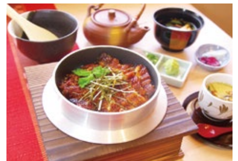
国産ひつまぶし 4,500 円