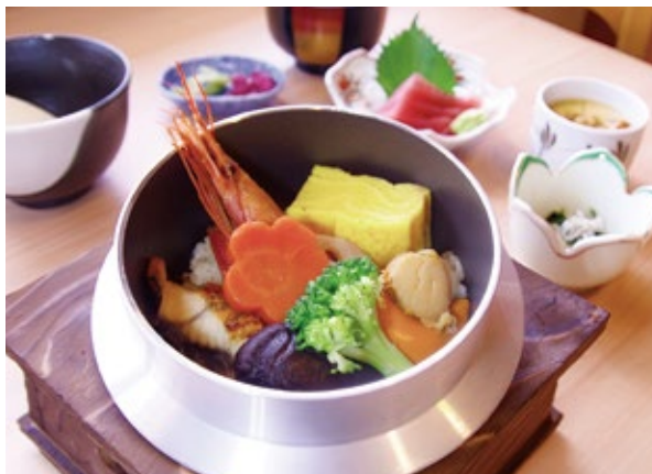
季節の釜めし定食 2,800 円