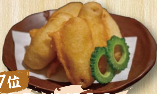
島魚の沖縄風天ぷら 900円