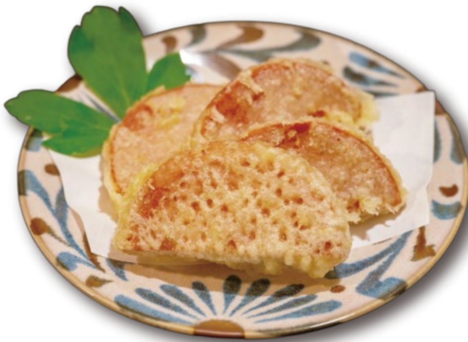
スパムの天ぷら 700円

沖縄で親しまれている「ポークランチョンミート」を衣で揚げた料理です。塩気とお旨味が強く、お肉のジューシーさが人気。