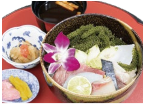
海鮮丼 2,300 円