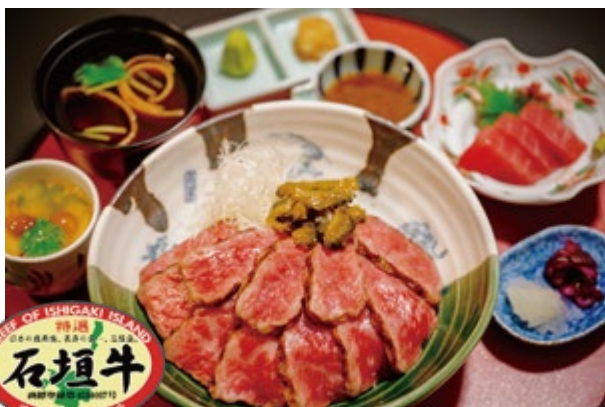
石垣牛ステーキ丼セット 6,000 円