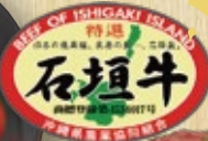
石垣牛 ローストビーフサラダ 2,500円