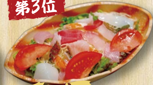
ひるぎ海鮮サラダ 1,800円 ハーフ 950円