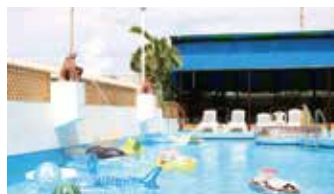
スイミングプール Swimming Pool