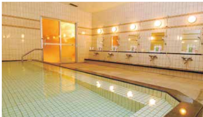
美咲の湯 Misaki Bath

Please relax while relaxing the tiredness of the trip with Misaki Bath.