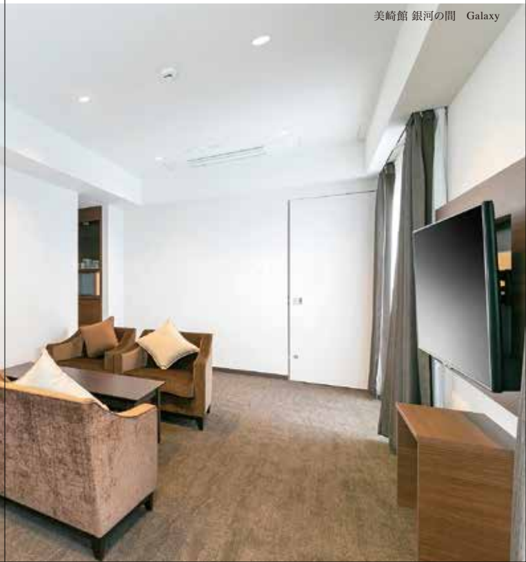
美崎館 銀河の間 Galaxy