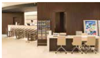
ツアーデスク Tour Desk