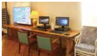
インターネットブース Internet Access Counter