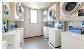
コインランドリー Laund Romat