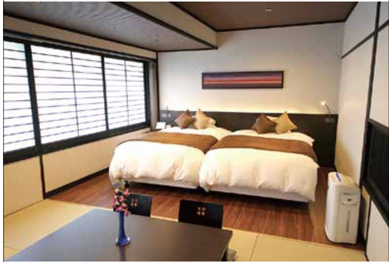
和洋特別室 Japanese-Style Special Room