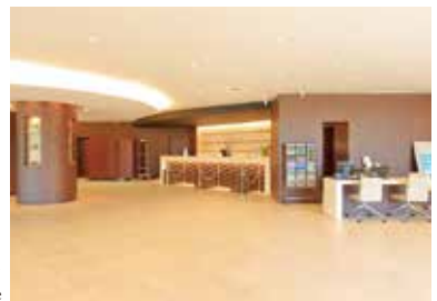
メインロビー Main Lobby Lounge

Hotel Miyahira promises the ultimate healing space and time.