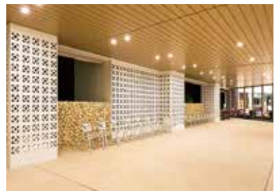
ピロティ Piloti (Entrance)